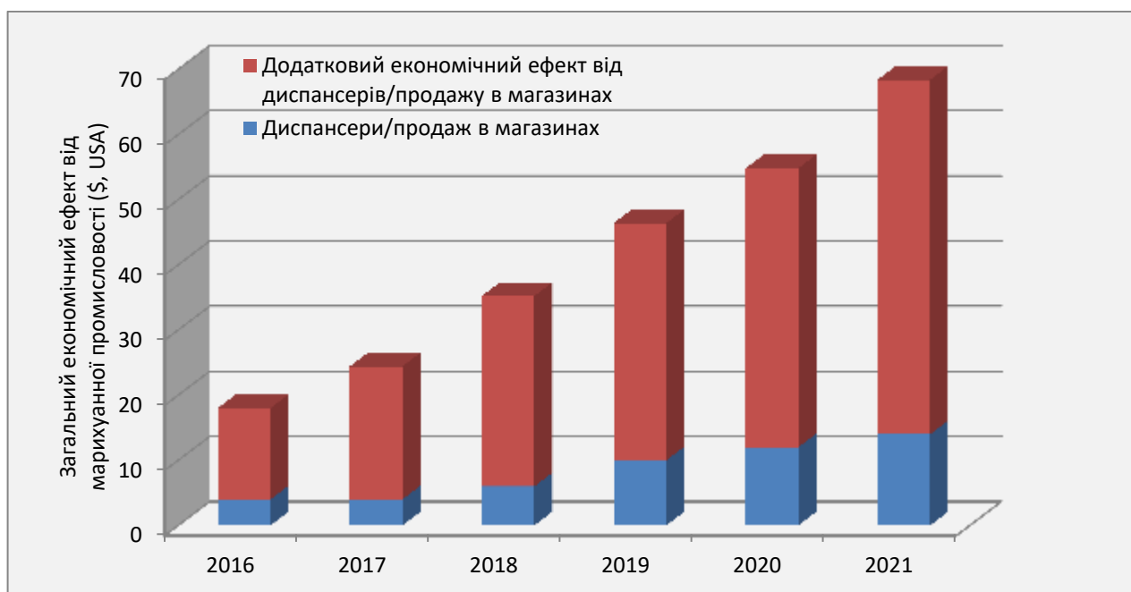
Графік 1. Промисловість канабісу США – загальний економічний вплив, 2016 – 2021 рр. (млрд. доларів США)

Джерело: побудова власна на основі даних Marijuana Business Factbook 2017 16